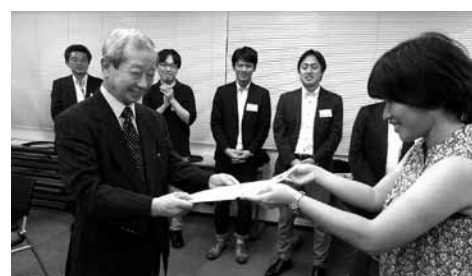
塾長による修了証の授与式

現在、協会ホームページにて、シンポジウムの概要を紹介するとともに、参加申し込みを受け付け中。多くの医療経営士に足を運んでいただきたい。