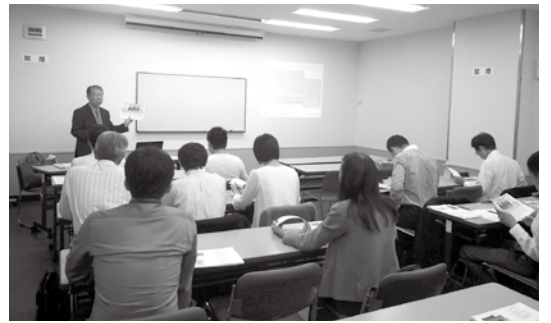
参加者からは「裏話も聞けて大変勉強になった」との声が聞かれた

また、報告対象にあたるかどうかの判断を行えるようなシステムを院内に構築しておくことで、連絡事項がきちんと伝わり、組織的な判断ができるようになるでしょう。具体的に決めてお